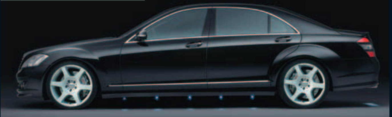
Monoblock A mit ABE with ABE

BRABUS also offers three different versions of its high-performance brake system for the new top-of-the-line Mercedes model.